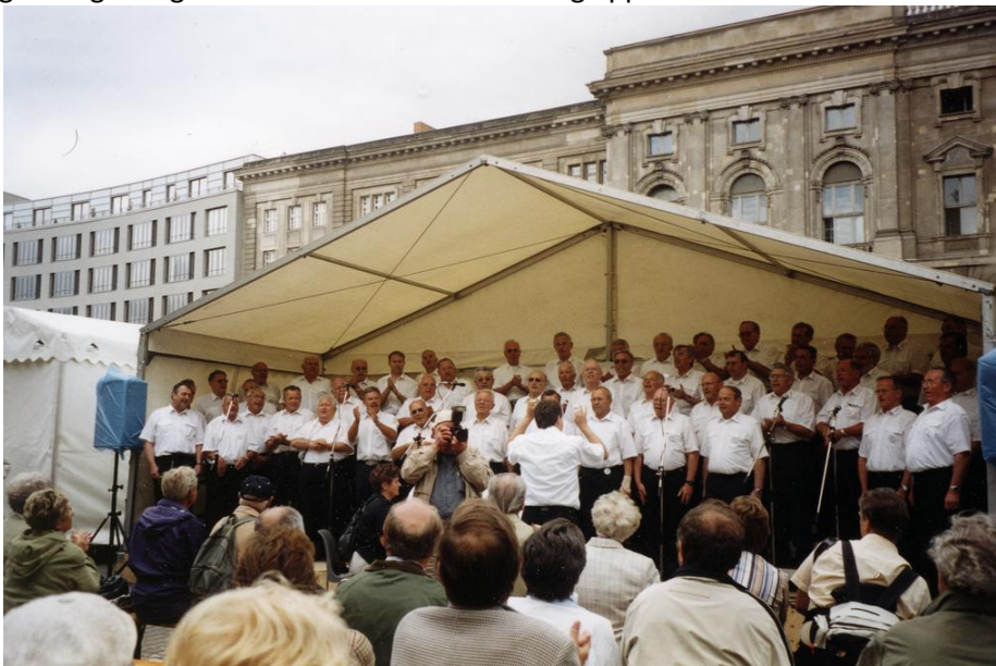
Auftritt in Berlin mit Sängern der SKG Bauschheim

Neben einer Stadtrundfahrt und der Besichtigung des Reichtages und des Plenarsaales des Deutschen Bundestags besuchten wir auch eine Aufführung im Friedrichstadtpalast. Der Höhepunkt war aber zweifelsohne der Samstag, der im Zeichen des Chorgesangs stand. Auf zwei Bühnen konnten wir unsere Gesangsdarbietungen gemeinsam mit den Bauschheimern zu Gehör bringen. Der erste Auftritt fand auf einer Bühne im Nikolaiviertel statt. Ein kurzer Fußmarsch brachte uns auf die Prachtstraße „Unter den Linden“. Dort war die Straße abgesperrt und auf insgesamt 26 Bühnen gab es drei Stunden ein einmaliges Klangerlebnis. Das zeigte sich auch am Publikum, das meist dicht gedrängt die ganze Straße säumte und fleißig applaudierte.